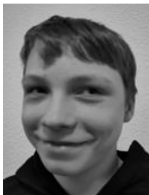
Jelde Schoon Timmler Str. 13