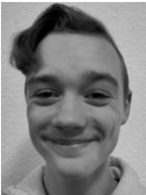
Maic Gruis Hauptstraße 144a